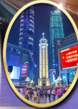
ถนนคนเดินเจียฟางเป็ย