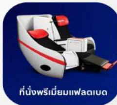
ที่นั่งพรีเมียมแพลนเบด

บริการอาหารร้อน และ น้ำดื่ม บนเครื่อง ขาไป และ ขากลับ