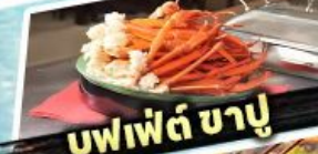
บุฟเฟต์ ซาบู