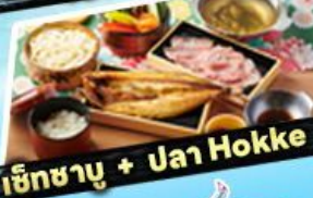
เซ็ทซาบู + ปลา Hokke