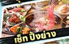
เซ็ท บิงย่าง