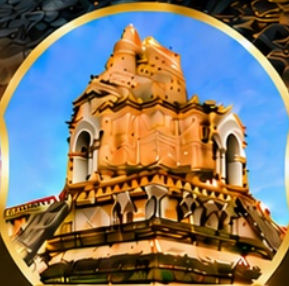
วัดเจดีย์หลวงวรวิหาร