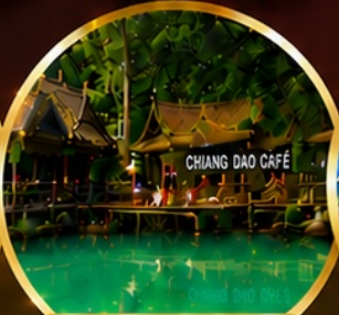
ท่าเชียงดาว