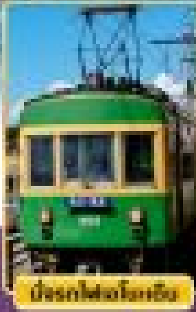
บริการรถไฟชินคันเซ็น