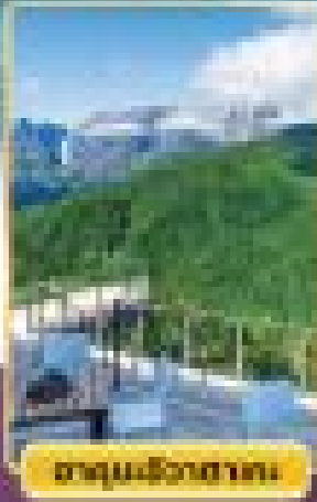
อุทยานฮิวาฮากะ