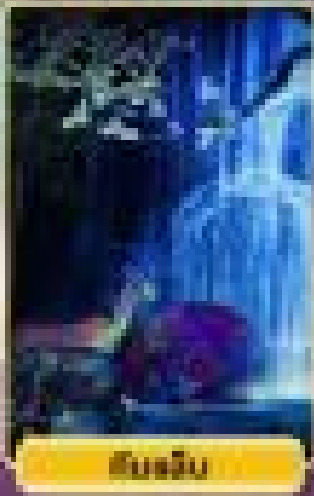
เขื่อนชิน