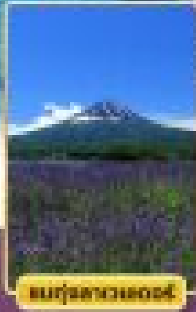
สวนกุหลาบฮอกไกโด