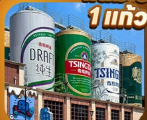
“พิพิธภัณฑ์เบียร์ซิงเต่า”

เสน่ห์เมืองชายฝั่งจินตตอนเหนือ • เวนิสตะวันออก • เก็บผลไม้ ณ สวนต้าเหลียน เมืองเหยียนโต • ท่าเรือให้ซาง ปลายาฟกยตัน • เมืองเฝิงไห่ • แปดเซียนข้ามทะเล เมืองเว่ยไห่ • ถนนคอบเพลิงเลว 8 • ซากเรือบลูวู • Korean Town • หมู่บ้านซาจื่อโจว สะพานจันเฉียว • โบสถ์เซนต์ไมเคิล • พิพิธภัณฑ์เบียร์ซิงเต่า • อ่าวผู้ชานวาน