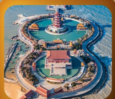
“แปดเซียนข้ามทะเล”

เสน่ห์เมืองชายฝั่งจินตตอนเหนือ • เวนิสตะวันออก • เก็บผลไม้ ณ สวนต้าเหลียน เมืองเหยียนโต • ท่าเรือให้ซาง ปลายาฟกยตัน • เมืองเฝิงไห่ • แปดเซียนข้ามทะเล เมืองเว่ยไห่ • ถนนคอบเพลิงเลว 8 • ซากเรือบลูวู • Korean Town • หมู่บ้านซาจื่อโจว สะพานจันเฉียว • โบสถ์เซนต์ไมเคิล • พิพิธภัณฑ์เบียร์ซิงเต่า • อ่าวผู้ชานวาน