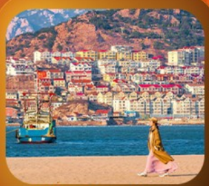
“หมู่บ้านประมงซาจื่อโจว”