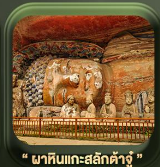
“ ผาหินแกะสลักต้าจู้ ”