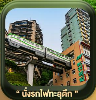
“ นั้งรถไฟทะลุตึก ”

บินตรงลงชิง • อุ้หลง หลุมฟ้าสะพานสวรรค์ • ระเบียงแก้ว • อุทยานเขานางฟ้า หงหยาดัง • นั้งรถไฟทะลุตึก • ศาลาประชาคม (ด้านนอก) • หลงหมินฮ่าว มรดกโลกผาหินแกะสลักต้าจู้ • วัดหลิวอัน • ตึกตะเกียบ • ถนนคนเดินเจียฟางเป่ย์