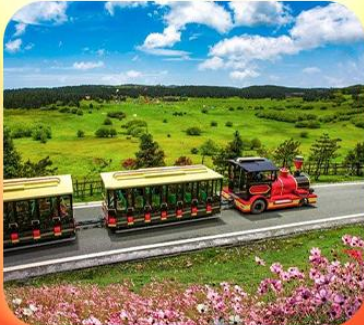
“อุทยานเขานางฟ้า”

บินตรงลงชิง • อุ่หลง หลุมฟ้าสะพานสวรรค์ • ระเบิดยงแกว • อุทยานเขานางฟ้า หงหยาดัง • นิ่งรถไฟทะลุติ๊ก • ล่องเรือชมฉางชิ่งยามค่ำคืน • ศาลาประชาม (ด้านนอก) มรดกโลกผาหินแกะสลักต้าจู้ • เมืองโบราณสี่ปาตี้ • วัดหลิวฮั่น • ตึกตะเกียบ