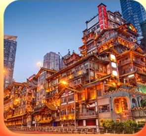
“ล่องเรือชมฉงชิ่งหงหยาดัง”