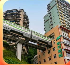
“นั่งรถไฟทะลุติ๊ก”