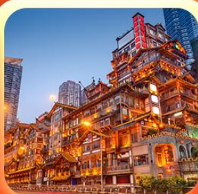
“ล่องเรือชมวิวหงหยาดัง”