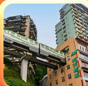
“นึ่งรถไฟทะลุติ๊ก”