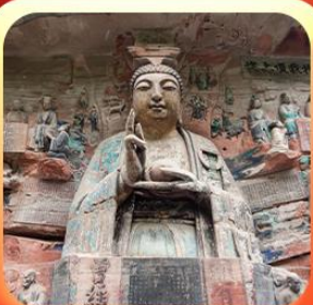
“ผาหินแกะสลักต้าจู้”

บินตรงลงชิง • อุ่หลง หลุมฟ้าสะพานสวรรค์ • ระเบิดยงแกว • อุทยานเขานางฟ้า หงหยาดัง • นิ่งรถไฟทะลุติ๊ก • ล่องเรือชมฉางชิ่งยามค่ำคืน • ศาลาประชาม (ด้านนอก) มรดกโลกผาหินแกะสลักต้าจู้ • เมืองโบราณสี่ปาตี้ • วัดหลิวฮั่น • ตึกตะเกียบ