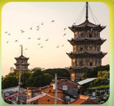
“เมืองโบราณฉวนโจว”