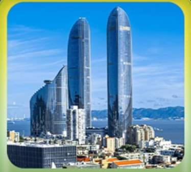
“ตึกแฝดเซี่ยเหมิน”