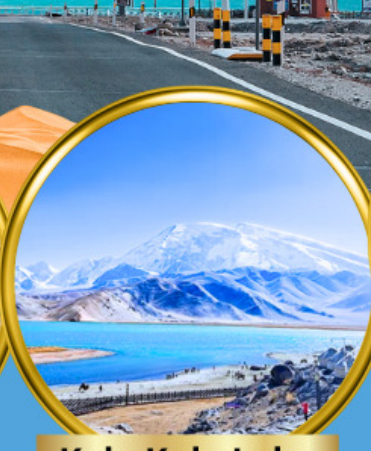
Kala Kule Lake