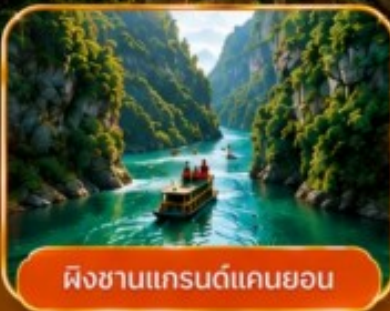
ผิงซานแกรนด์แคนยอน