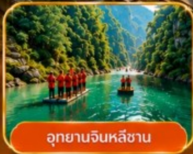
อุกยานจินหลี่ซาน