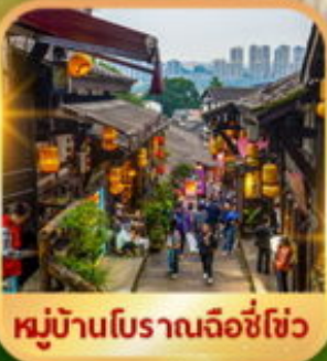
หมู่บ้านโบราณฉือชี่เซว