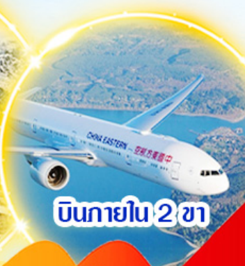
บินภายใน 2 ชม