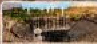
เมืองเอียนาโกล