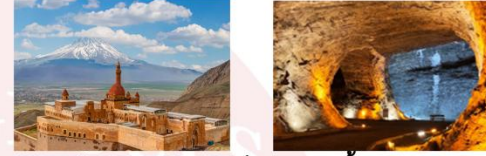
พระราชวังอิซฮาก พาชาร์ ถ้ำเกลือ

** พักที่ Kale Hotel 4* หรือเทียบเท่า **