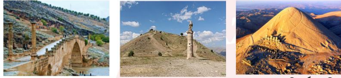
สะพานเซเวอร์ริน สุสานคาราคูช ชมพระอาทิตย์ตกดิน

** พักที่ Nemrut Euphrat Hotel 4* หรือเทียบเท่า **