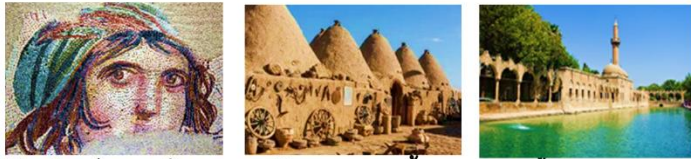
พิพิธภัณฑชุกมา โมเสก บ้านแบบรวงผึ้ง ถ้ำอับราฮัม

** พักที่ Harran Hotel 5* หรือเทียบเท่า **