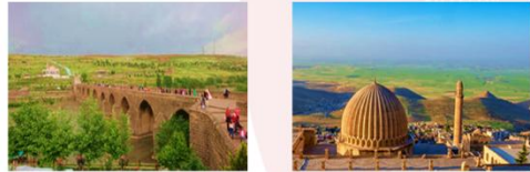
สะพานสิบโค้ง เมืองมาร์ดิน

** พักที่ Yay Grand Hotel 4* หรือเทียบเท่า **