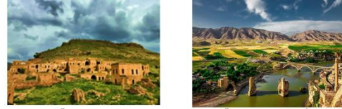
เมืองดารา เมืองฮาซานคีฟ

** พักที่ Kardelen Hotel 4* หรือเทียบเท่า **