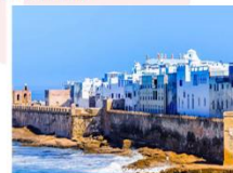
เมืองเอสซาออูรา

DAY10 เอสซาออูรา-เมืองเก่า-ท่าเรือเอสซาออูรา-กำแพงเมืองคาซาบลังกา (โมร็อกโก)