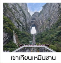
เขาคิยงเหมินชาน

ฉลองเที่ยวบินปฐมฤกษ์ เก็บครบทุกไฮไลต์!! วันที่ 10 พฤษภาคม 2569 กรุงเทพฯ - อางซา (จางเจียเจีย)