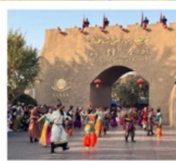
เมืองโบราณคัชการ์