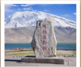
ทะเลสาบกาลากูเล่อ