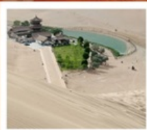
เขื่อนทรายหมิงซาซาน