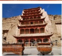
ถ้ำม้อเกา