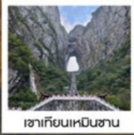
เขาคิยงเหมินซาน

พิเศษ!!...รอบค่ำเช้าชุดพื้นเมืองที่ฟ่งหวง • รอบค่ำช่างถ่ายรูป น้ำตกฟูหรง