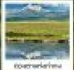
เที่ยวทะเลสาบ

กรุ๋ฉวนกั๋วหนานหนานหนาน • ภูเขาหนานหนานหนานหนาน • ป๋องแดง หนานหนานหนานหนาน • ภูเขาหนานหนานหนานหนาน • ภูเขาหนานหนานหนานหนาน ภูเขาหนานหนานหนานหนาน • ภูเขาหนานหนานหนานหนาน • ภูเขาหนานหนานหนานหนาน ภูเขาหนานหนานหนานหนาน • ภูเขาหนานหนานหนานหนาน • ภูเขาหนานหนานหนานหนาน ภูเขาหนานหนานหนานหนาน • ภูเขาหนานหนานหนานหนาน • ภูเขาหนานหนานหนานหนาน