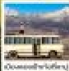
เที่ยวสวนสัตว์ป๋องแดง

เที่ยวรถพิเศษ ไปสวนสัตว์ป๋อง ป๋องแดงป๋อง