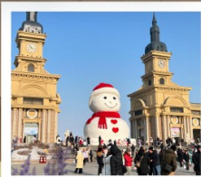
ตึกตาคิมะยักซ์