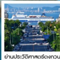
ย่านประวัติศาสตร์ตงกวน

Fisherman's Wharf • จัดริสซิงไห่ (รวมรถราง) • ถนนตงกวน • เวนิสแห่งต้าเหลียน • ถนนรัสเซีย