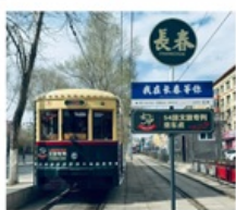
นั้งรรางดางซุน