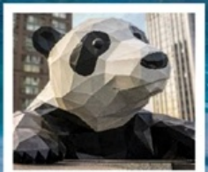
ห้าง IFS แพนด้าปิ่นตึก

จัดทริปหย่างเกี้ยนฉู่ / รูปปั้นหมีแพนด้าเซลฟี / เมืองโบราณกัวนเซี่ยน คำธารสีฟ้า / อุทยานภูเขาสี่ดรุณี / อุทยานชวงเฉียวโกว (รวมรถอุทยาน) อุทยานปี้ผิงโกว (รวมรถอุทยาน + รถแบตเตอรี่) / อุทยานจิวจ้ายโกว (รวมรถเหมา) ถนนคนเดินซุนชู่ / ห้าง IFS แพนด้าปิ่นตึก / ถนนคนเดินไท่กู่หลี่ ถนนคนเดินชอยกวางแคว (POP MART)