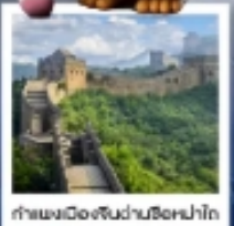
กำแพงเมืองจีนผ่านซือหม่าโต

เมืองโบราณกู่เป่ย์ซู่เจิ้น / กำแพงเมืองจีนด่านซือหม่าโต (รวมค่ากระเช้าขึ้น-ลง) / ชมวิวกำแพงเมืองจีนและเมืองโบราณ ยูนิเวอร์แซลปักกิ่ง (รวมค่าบัตรเข้า) / จตุรัสเทียนอันเหมิน / พระราชวังโบราณฤดูร้อน / หอขงจื้อ คาเฟ่ทังฟังกาแฟบ้านน้ำตาด (TANG FANG CAFE) / พระราชวังฤดูร้อนอวิ๋นเหอหยวน / ย่านชานหลี่ถุน (POP MART) / ถนนคนเดินไท่กู่หลี่