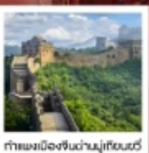
กำแพงเมืองจีนด้านมู่เถียนยวี่