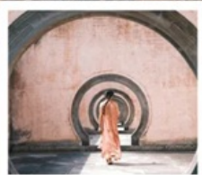
หมู่บ้านโบราณเฉิงชาน