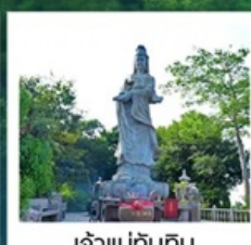
เจ้าแม่ทับทิม