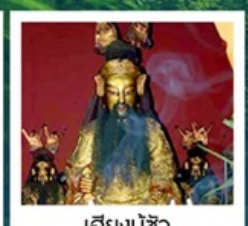
เฮียงบู๊ซิว