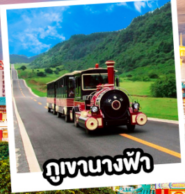
ภูเขาทางฟ้า