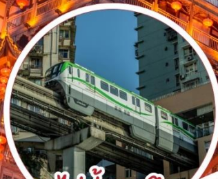
รถไฟฟ้า-ลูตึก Liziba Station