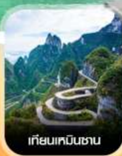
เกียมเหมินซาน