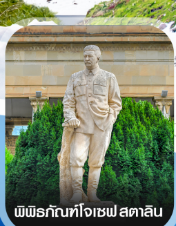
พิพิธภัณฑ์โจเซฟ สตาลิน

✈️ คอนเฟิร์มออกเดินทาง ทุกพีเรียด 2 ท่านขึ้นไป