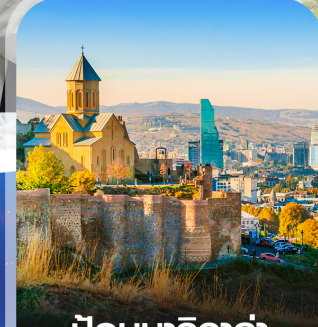
ป้อมนาริกาล่า