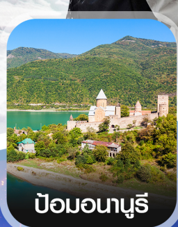
ป้อมอนานูรี