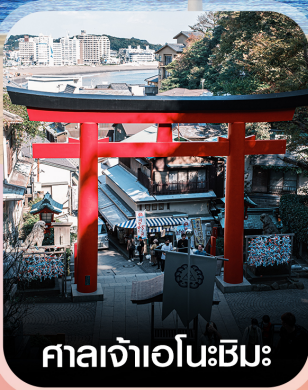
ศาลเจ้าเอโนะชิมะ