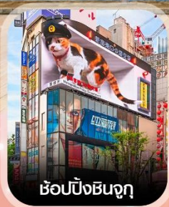
ซ้อปป์ชินจูกุ

✈️ คอนเฟิร์ม ออกเดินทาง ทุกพีเรียด 2 ท่านขึ้นไป