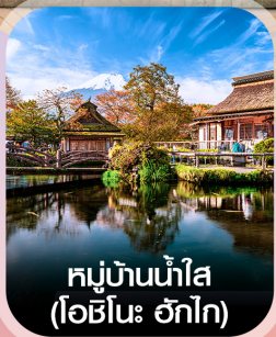
หมู่บ้านน้ำใส (โอชิโนะ วิกโก)