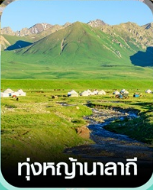
ทุ่งหญ้านาลาถิ