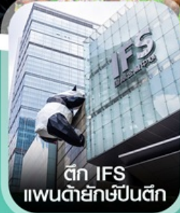
ตึก IFS แพนด้ายักษ์ป็นตึก