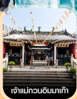
เจ้าแม่กวนอิมมาเก๊า

✈️ คอนเฟิร์มออกเดินทาง ✈️ ทุกพีเรียด 2 ท่านขึ้นไป