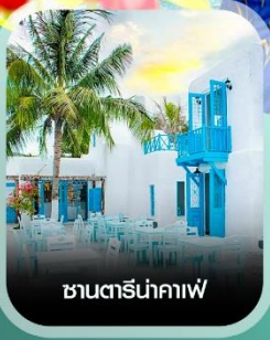
ซานโตรินาคาฟ