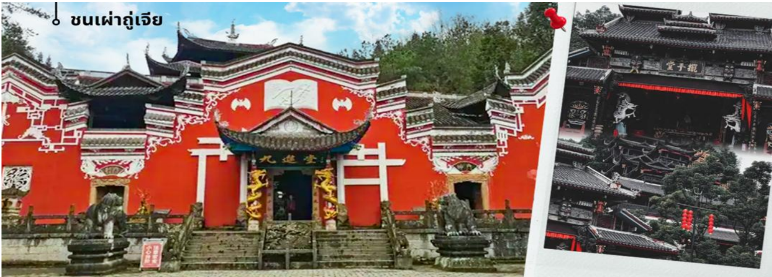
ชนเผ่าถู่เจีย

จากนั้นนำท่านเดินทางสู่ ชนเมืองชนเผ่าถู่เจียเอินซือ เป็นหนึ่งในกลุ่มชาติพันธุ์ที่มีจำนวนประชากรมากที่สุดในเขตนี้ จนทำให้อินซือได้ชื่อว่าเป็น “บ้านของชนเผ่าถู่เจีย” วัฒนธรรมของถู่เจียมีเอกลักษณ์ ทั้งด้านภาษา การแต่งกาย และประเพณีดั้งเดิม เช่น การรำมือ “ปายชั่ว” ซึ่งเป็นการเต้นรำหมู่ที่ใช้ท่ามือและท่าก้าวเท้าในการบอกเล่าเรื่องราว อีกทั้งยังมีเทศกาลเฉพาะของถู่เจีย เช่น เทศกาลปายชั่ว ที่จัดขึ้นเพื่อบูชาบรรพบุรุษและเฉลิมฉลองความเป็นชุมชนชนเผ่าถู่เจียในอินซือเป็นเสน่ห์สำคัญของการท่องเที่ยวเมืองนี้ เพราะนักท่องเที่ยวจะได้ทั้งชมภูมิทัศน์ที่สวยงาม และเรียนรู้วัฒนธรรมชาติพันธุ์ที่ยังคงรักษาขนบประเพณีดั้งเดิมไว้อย่างชัดเจน