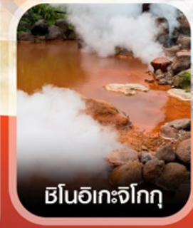
เซ็นโอะกะจิกุ