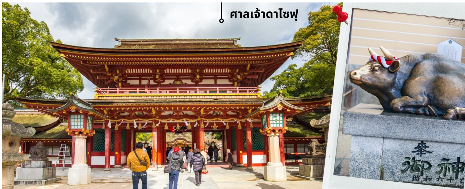
ศาลเจ้าดาไซฟุ

07.55 น. เดินทางถึงสนามบินนานาชาติฟุกุโอกะ ประเทศญี่ปุ่น หลังจากผ่านพิธีตรวจคนเข้าเมืองและศุลกากรแล้ว นำท่านขึ้นรถโค้ชปรับอากาศ จากนั้นเดินทางสู่ เมืองฟุกุโอกะ นำท่านเดินทางสักการะขอพรที่ ศาลเจ้าดาไซฟุ ศาลเจ้า แห่งนี้สร้างขึ้นสักการะเทพเท็นจิน เทพเจ้าแห่งการศึกษาของญี่ปุ่น อยู่ที่เมืองดาไซฟุ จังหวัดฟุกุโอกะ มีความสวยงาม และประวัติศาสตร์ที่น่าสนใจ หนึ่งในไฮไลท์ที่ดึงดูดให้นักท่องเที่ยวมาที่นี่คือ สะพานไทโคบาชิ (Tai Ko Bridge) ที่มี ลักษณะเป็นสะพานสีแดงสด เรียงต่อกัน 2 สะพาน โดยเป็นสัญลักษณ์ของ “อดีต - ปัจจุบัน - อนาคต” และอีกหนึ่ง จุดที่คนนิยมมาถ่ายรูปกันก็คือ การมาลูปหัวรูปปั้นวัว ที่ศาลเจ้า นอกจากจะมีศาลเจ้าให้ไหว้สักการะแล้ว ยังมีสถาปัตยกรรมที่ งดงาม และร้านอาหารอร่อยๆให้ได้ลองอีกด้วย