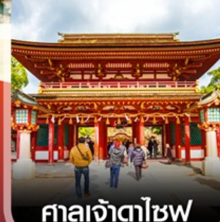
ศาลเจ้าตาไซฟุ