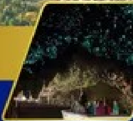
ถ้ำหมอบเรือแสง

Food อาหารแบบ บุฟเฟ่ต์บนยอดเขา บิอนส์ฟิค