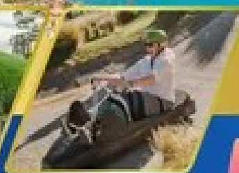
เล่นลuge ที่คริสตchurch

✚ บินภายใน (เที่ยวสุดคุ้ม) พักโรงแรม 4 ดาว ★★★★★