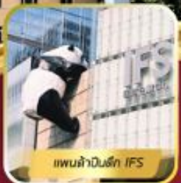
แพนด้าปาร์ค IFS