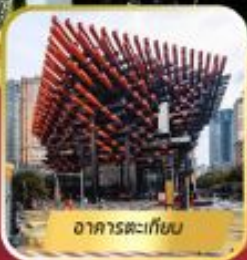
อาคารตะเกียบ