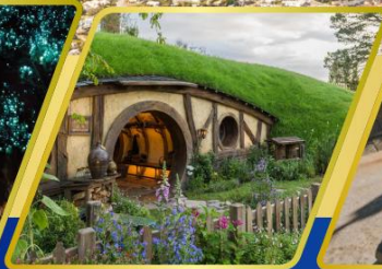
หมู่บ้านฮ็อบบิต