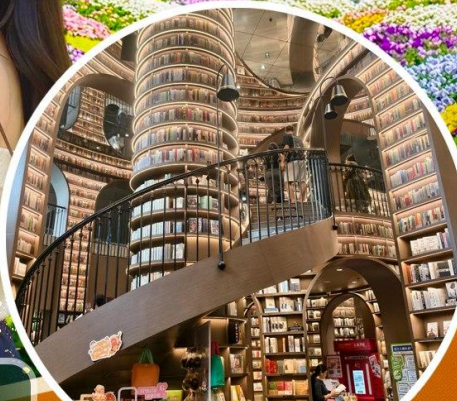
จางชู่เก๋อ