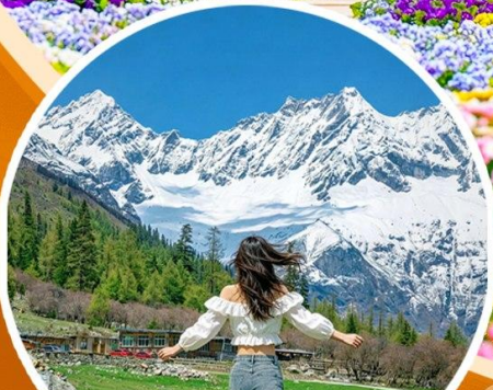
ภูเขาสีดรุณี ช่วงเลี้ยวโกว (รวมรถอุทยาน)

สวนสวรรค์แห่งดอกไม้MANHUA-จางชู่เก๋อ-จัตุรัสหย่างเทียนวู่-รูปปั้นแพนด้าเซลฟี่ เมืองโบราณกวนเซียน-อุทยานเขาสีดรุณี(รวมรถอุทยาน)-สะพานหนานเจียว เมืองลั่วไต้-ตึกแฝด-SKP-วัดต้าจื่อ-ถนนคนเดินซุนซีลู่-IFS-ตงเจียวจี้-ถนนคนเดินไท่กุหลี่