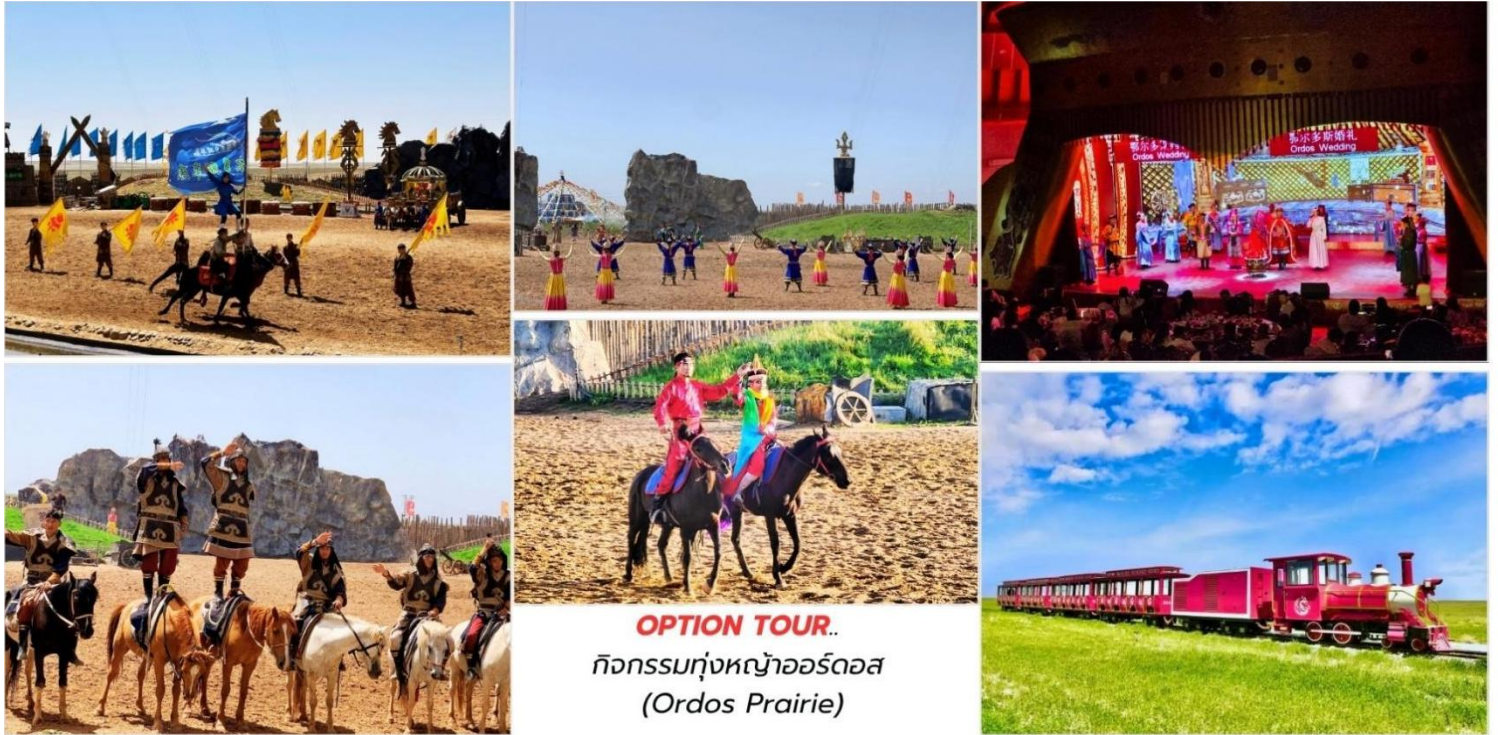
OPTION TOUR.. กิจกรรมทุ่งหญ้าออร์ดอส (Ordos Prairie)

บ่าย สมควรแก่เวลา นำท่านเดินทางกลับสู่ เมืองออร์ดอส ใช้เวลาเดินทางประมาณ 2 ชั่วโมง