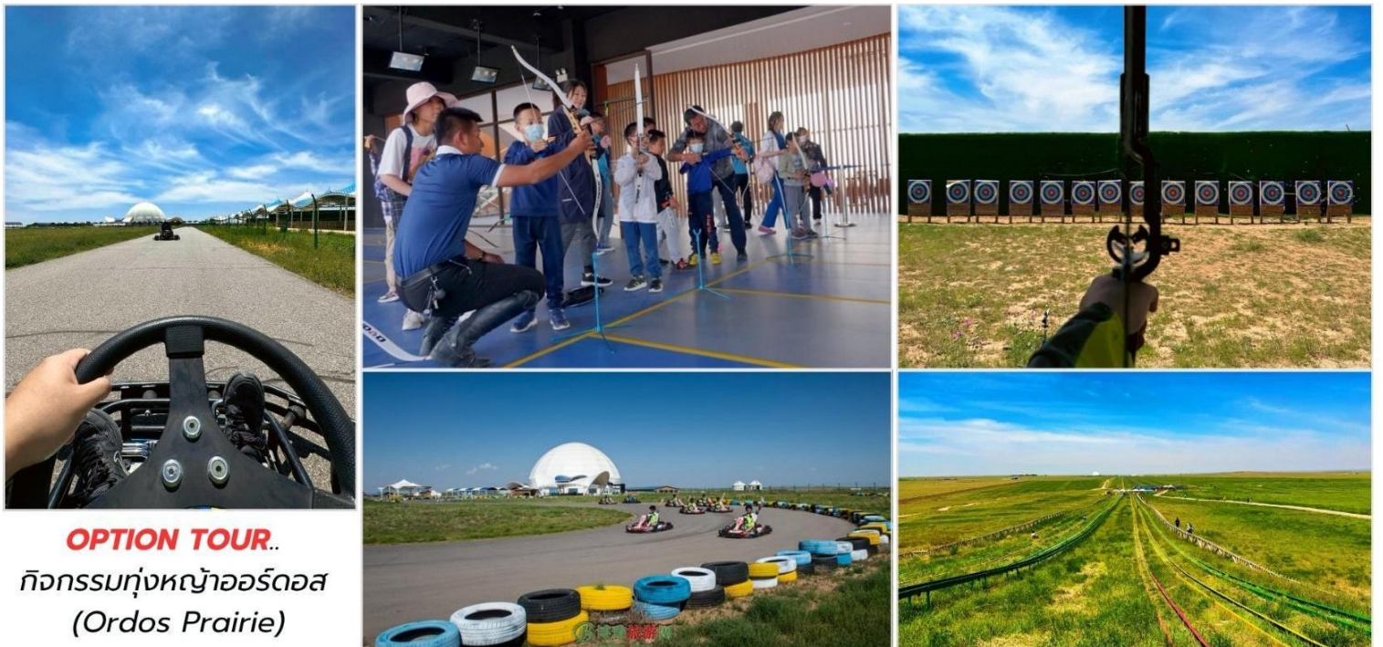
OPTION TOUR.. กิจกรรมทุ่งหญ้าออร์ดอส (Ordos Prairie)