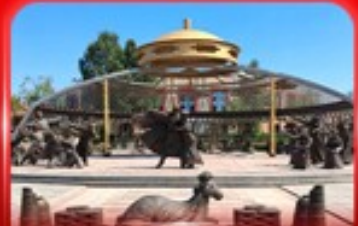
สวนวัฒนธรรมการแต่งจานอวอร์ดอส