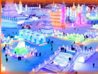
เที่ยว ICE & SNOW WORLD