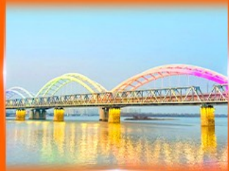
สะพานรถไฟผืนโจว