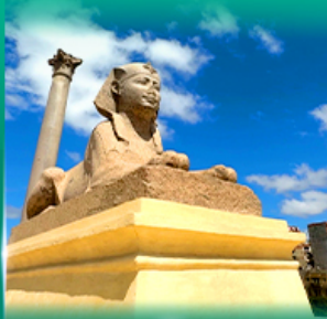
เสาริมนปอมเปย์