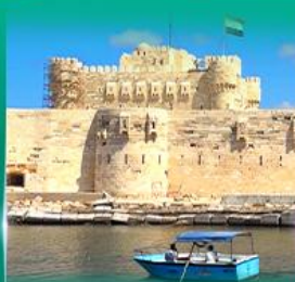
บิอุมปราการ Quite Bay