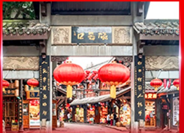
หมู่บ้านโบราณฉิวซีโหว่