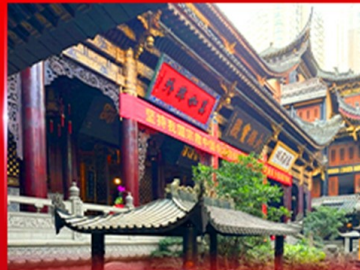
วอพรวัดหลิวฉิน ฉงชิ่ง