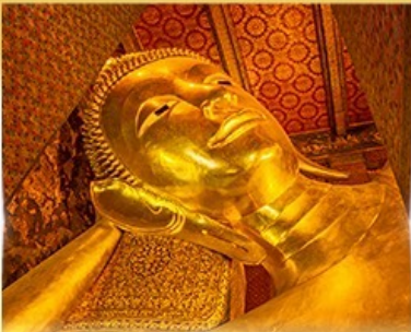
วัดพระเชตุพนวิมลมังคลาราม (วัดโพธิ์)