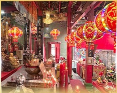
ศาลเจ้ากวนอู คลองสาน