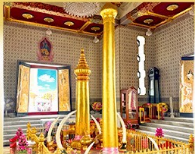
ศาลหลักเมือง กรุงเทพมหานคร