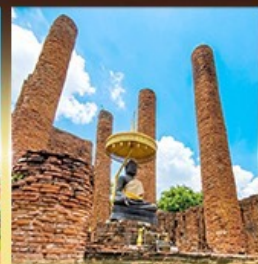
วัดธรรมิกราช