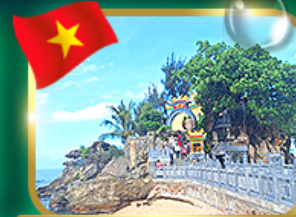
สักการะขอพรศาลเจ้าอโศก